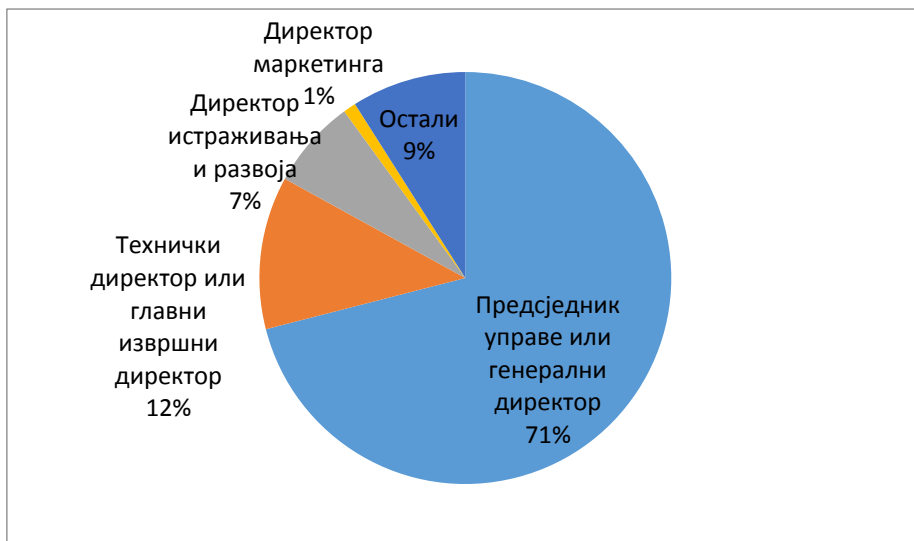
Графикон 1. Главни заговорник иновација у анкетираним предузећима

Према истраживању консултантске фирме за менаџмент „Boston Consulting Group - BCG“ ( www.bcg.com ) многи лидери су видјели како њихови сопствени тимови или конкуренти постижу иновативне подвиге у само неколико недјеља, које су претходно трајале мјесецима и траже начине да усвоје нове начине рада. У локалним предузећима су врховни менаџери углавном покретачи идеје о иновирању како се види на графикону 1.