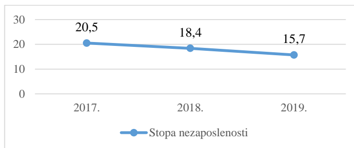
Grafikon 2. Stopa nezaposlenost u %

Slijedi i grafički prikaz stope nezaposlenosti posmatrane u toku tri uzastopne godine (2017, 2018, 2019. godine).